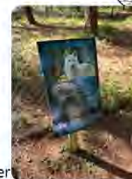
Affiche explicative d'un loup