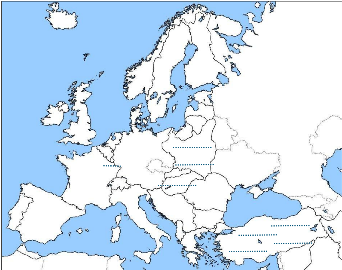
Carte de l'Europe en 1939

5. Précise l'origine des familles juives, en écrivant leurs noms sur la carte.