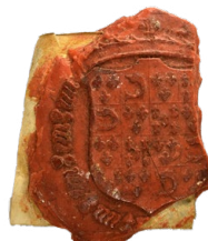
Empreinte de sceau de François III de Bretagne (vers 1532). (AD22, 1 J 208)