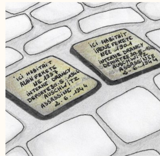
Extrait de la BD Destination inconnue réalisée par les élèves du collège Charles-de-Gaulle d'Hillion.

Étoile juive (spécimen). (AD22, 5 W 194)