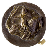
Empreinte de sceau de Guillaume de Rochefort (1281). (AD22, fonds de l'abbaye de Léhon H 420)