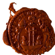
Empreinte de sceau de l'abbaye de Beauport. (AD22, 2 G 21)