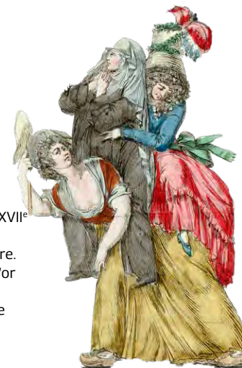
« La fermière en corvée » (1789). (BNF, RESERVE FOL-QB-201)

« Le Code paysan », gravure sur bois réalisée par René-Yves Creston vers 1941 (Musée départemental breton)