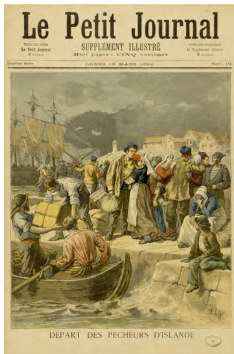
“Départ des pêcheurs d’Islande”, Le Petit Journal, supplément illustré du 19 mars 1894. (AD22, 186 J 56)

Pour commencer vos recherches sur un marin, vous devez d’abord connaître son année de naissance et son lieu de résidence. A partir de ces informations, vous pourrez déterminer à quel quartier et à quel syndicat maritime votre ancêtre était rattaché 1 . À défaut du domicile, il est possible d’essayer la recherche à partir du lieu de naissance, de mariage ou de décès.