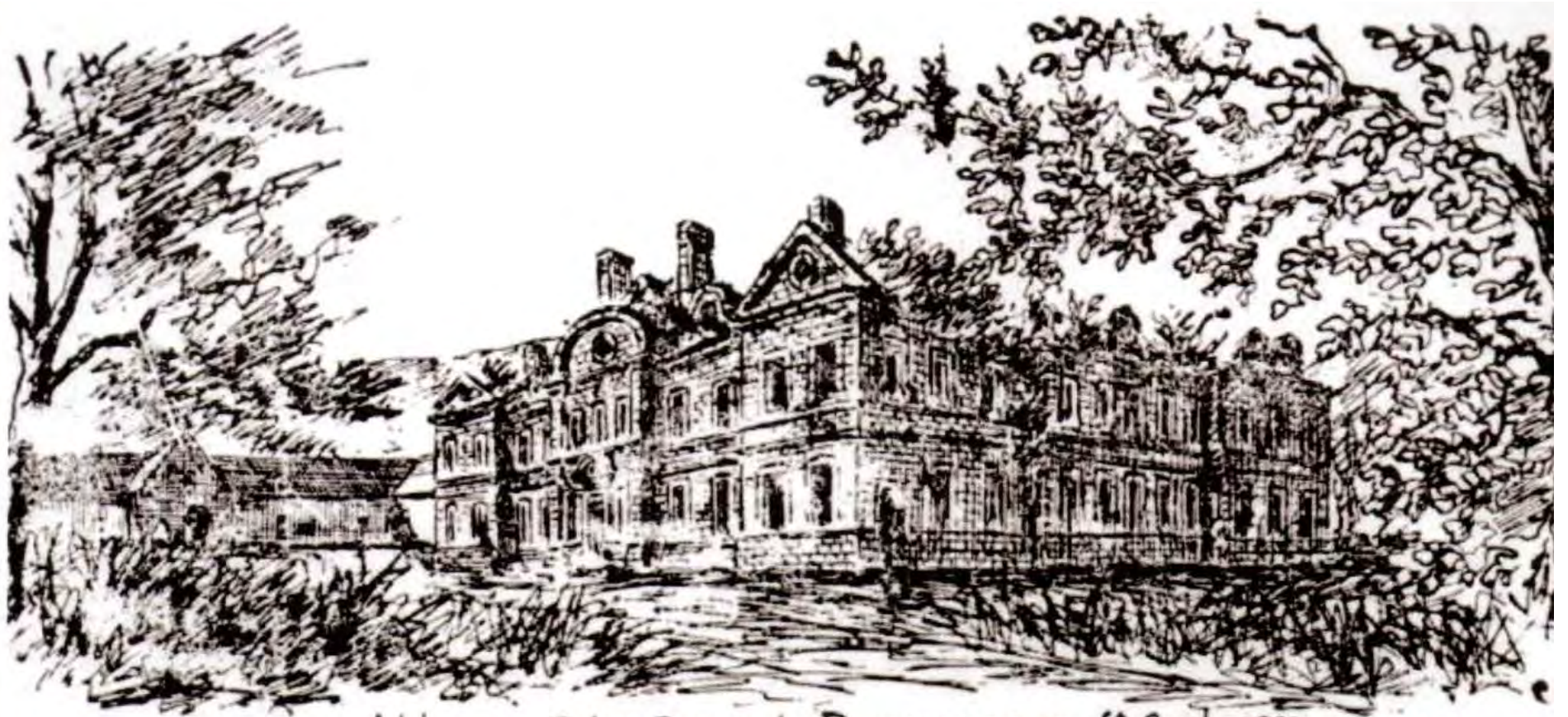
Abbaye Notre Dame de Bonrepos en S' Gelven dessiné sur 25 juillet 1876