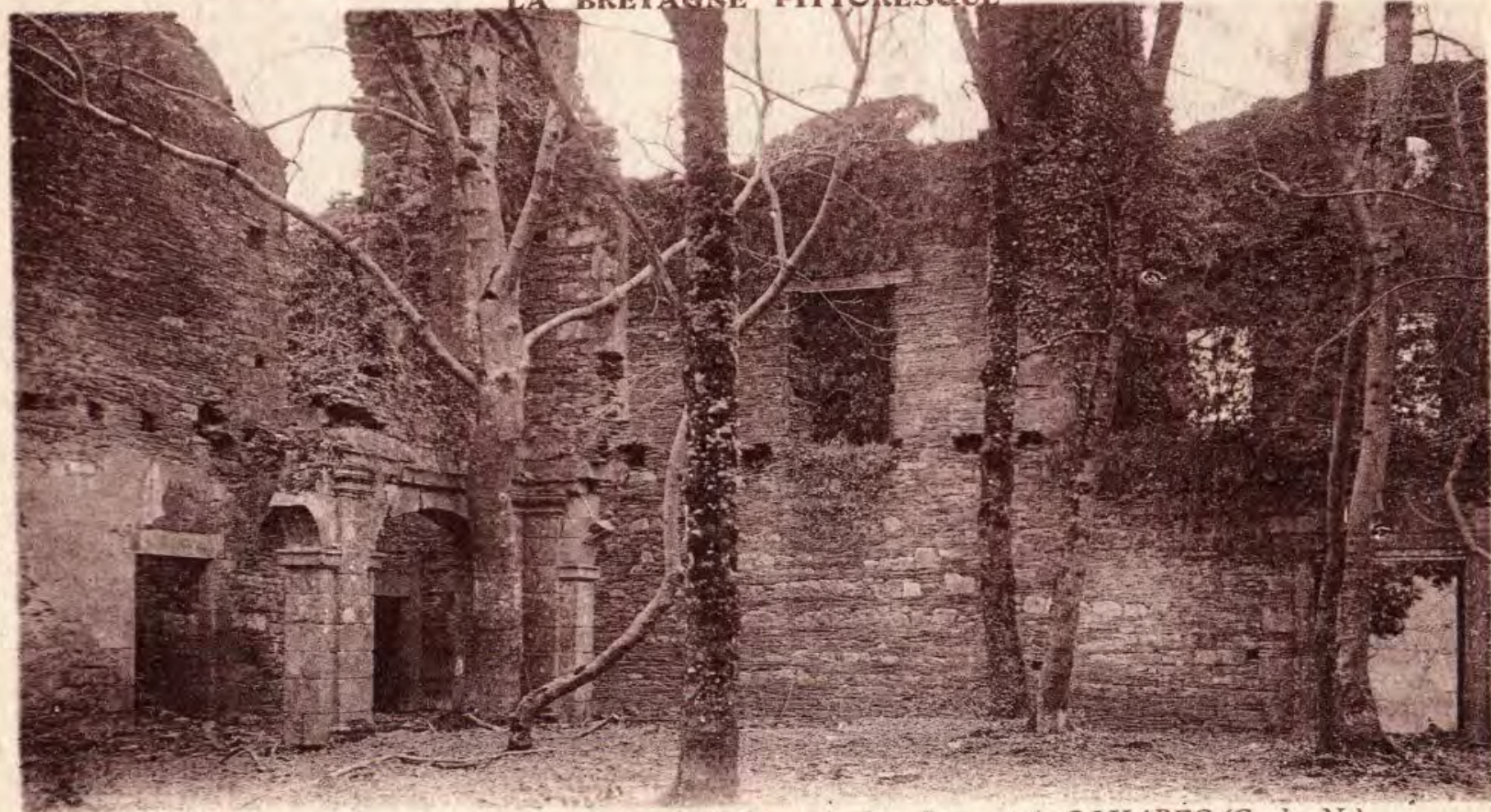
A. W. - 4125 — Intérieur des Ruines de l'Abbaye de Bon-Repos, près GOUAREC (C.-du-N.)