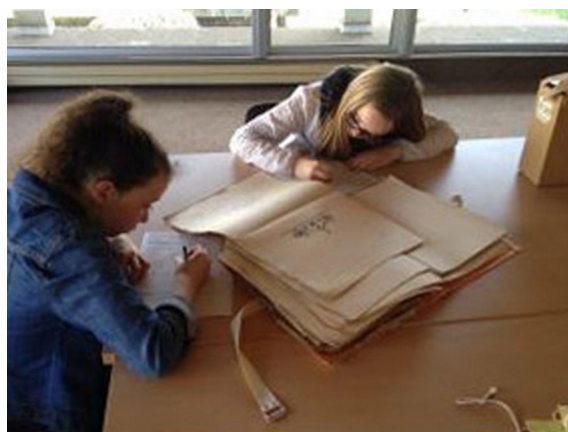
Séance consacrée à l'école autrefois