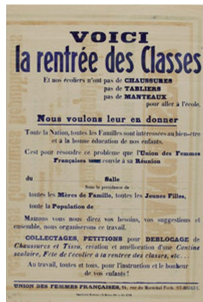
"Voici la rentrée des classes" 1945, 25 Fi 114

Chaque mois découvrez une notice explicative d'un document sélectionné pour le calendrier de l'année en cours sur notre site internet – Le document du mois et sa rétrospective