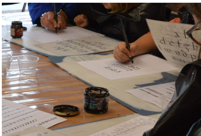
Atelier pratique de calligraphie