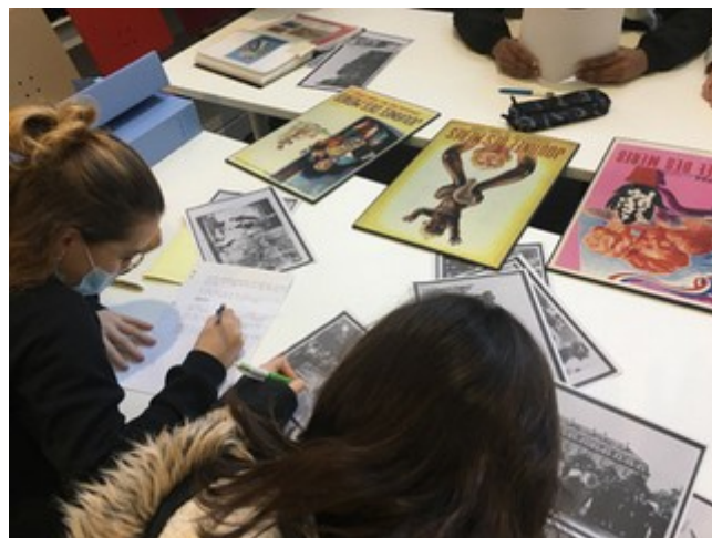
Séance itinérante consacrée à la Deuxième Guerre mondiale