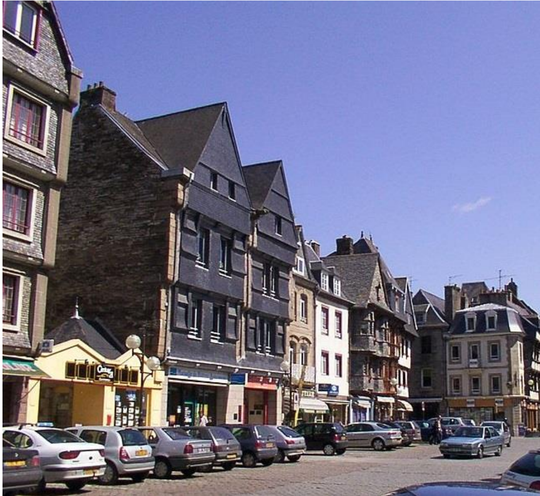
La place du Général-Leclerc