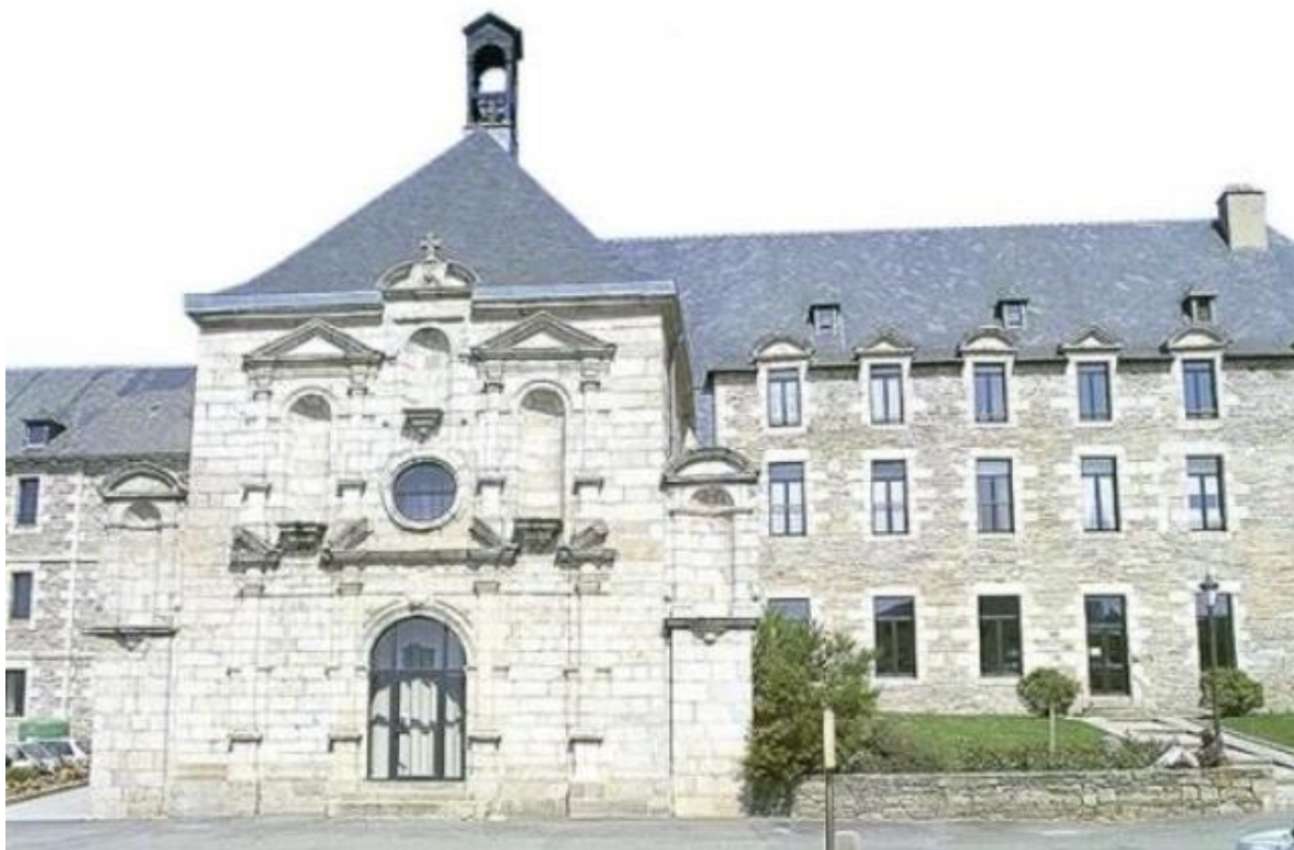
L'ancien couvent des Ursulines rénové