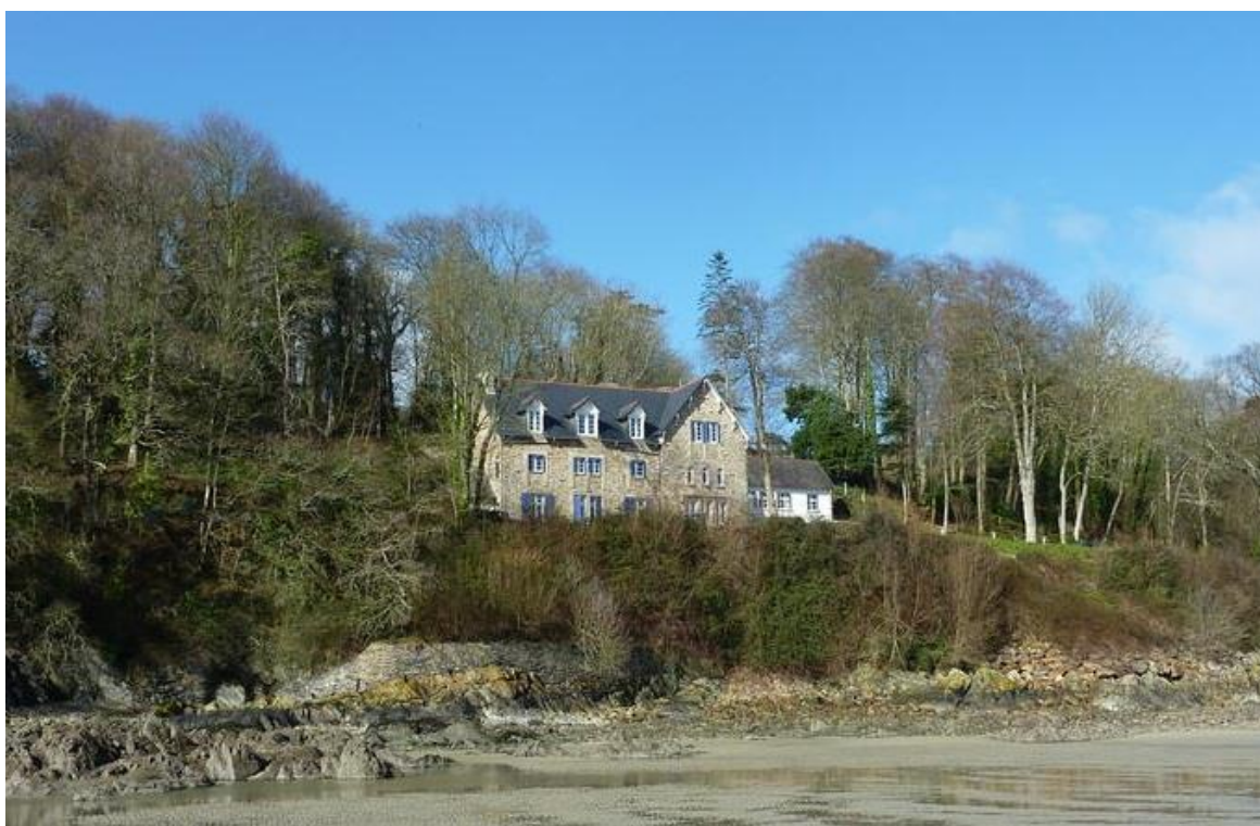
La colonie de vacances du Toulinet

5 W 152 Centre de loisirs sans hébergement Joseph-Le-Gall de Kerligonan. – Rénovation. 1497