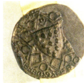
Sceau du duc de Bretagne, 1366

Le drapeau breton se compose de 11 hermines: 4 sur les lignes supérieure et inférieure, 3 au centre. Complète la partie contenant les hermines.