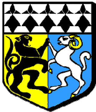
Logo et armoiries du département du Finistère