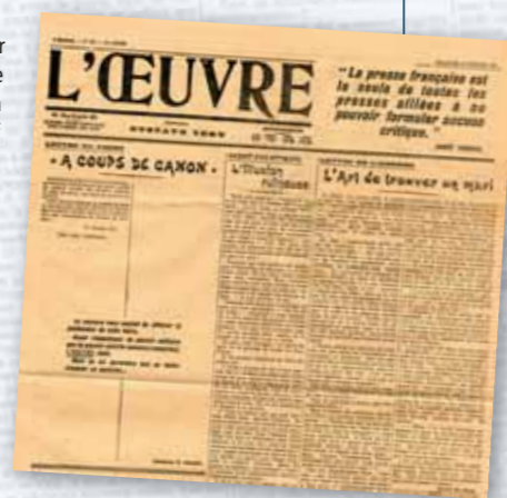
Page de "Une" du journal L'Œuvre, le 25 février 1917. Archives départementales des Côtes-d'Armor, 4 Z 138

Emmanuel Laot , professeur d'histoire-géographie, conseiller-relais du service éducatif des Archives départementales des Côtes-d'Armor