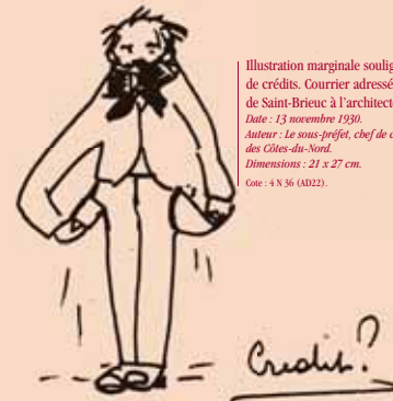
Illustration marginale soulignant un manque de crédits. Courrier adressé par le sous-préfet de Saint-Brieuc à l'architecte départemental. Date : 13 novembre 1930. Auteur : Le sous-préfet, chef de cabinet du préfet des Côtes-du-Nord. Dimensions : 21 x 27 cm. Cote : 4 N 36 (A022).

«Toi qui veux rebâtir la France... donne lui d'abord des enfants». 1940-1944. Dimensions : 120 x 77 cm. Auteur : Pierre Guich et Ch. Stéfani. Technique : impression en couleurs. Cote : 25 H 82 (A022).